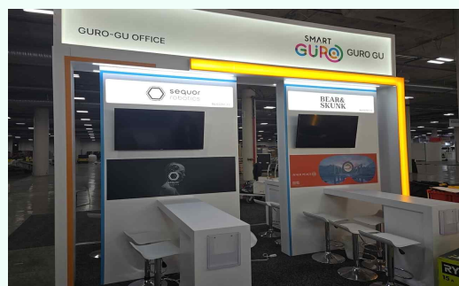
[참고] CES 2026 구로G밸리관 전경 SMART GURO